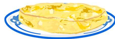
una tortilla de patatas