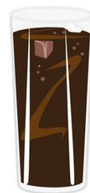
una coca cola