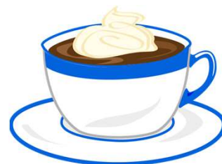
un chocolate caliente