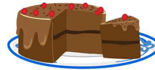
una tarta de chocolate