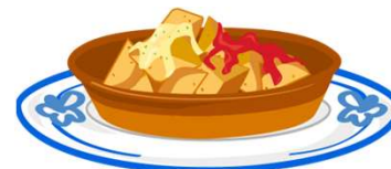
unas patatas bravas