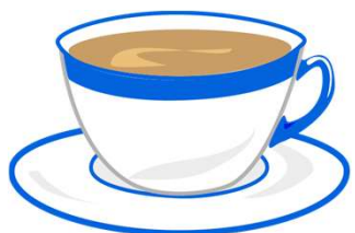
un café con leche