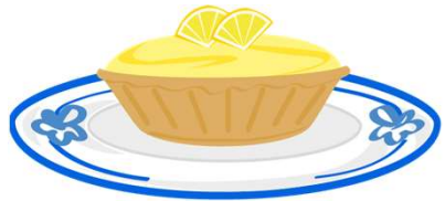
un pastel de limón