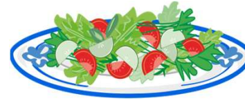
una ensalada mixta