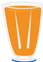
un zumo de naranja